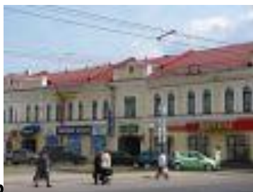
Красный гостиный двор

Красный гостиный двор построен в 1873-1875 годах по образу и подобию Мучного гостиного двора, в котором в то время всем рыбинским торговцам места не хватало. Автором проекта стал архитектор М. Ломакин.