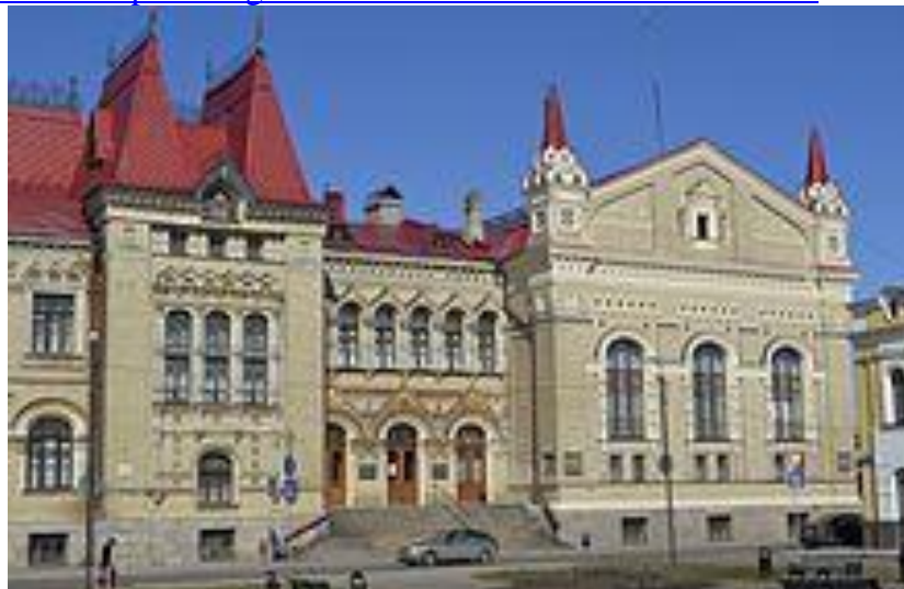
Биржа: вид со стороны Красной площади.