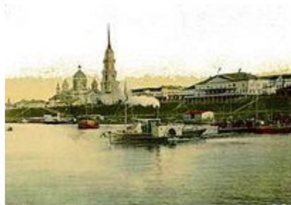
Вид Рыбинска конца XIX века