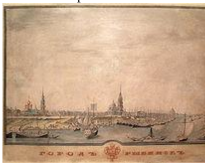
Город Рыбинск (1848 г.)

Для урегулирования этих ценово-организационных вопросов и существовала Рыбинская хлебная биржа.