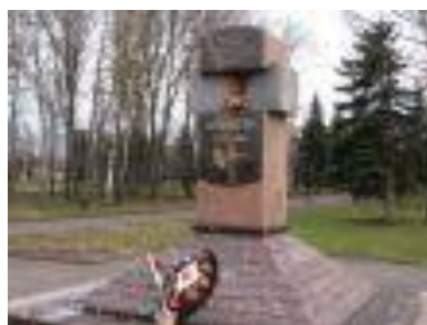
Памятник погибшим интернационалистам

Петровский парк находится на левом берегу Волги.