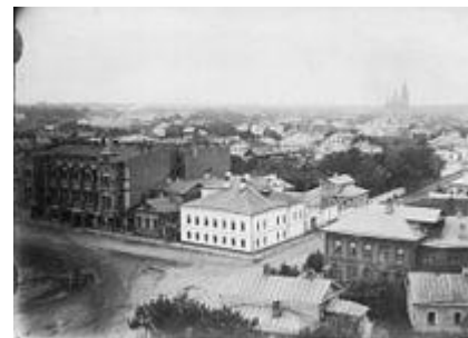
Вид Рыбинска с пожарной каланчи (1900-е гг.)

В городе развивается и промышленность. Купец Н. М. Журавлёв в 1859 году строит в окрестностях города крупнейшую в Европе канатную фабрику, затем кирпичный и судостроительный заводы (затоплены при строительстве водохранилища в 1940 году). Строится чугунолитейный завод Головина и железнодорожные мастерские (на базе которых ныне работает завод дорожных машин «Раскат»). В городе работали крупные мукомольные фабрики купца Е. Калашникова и А. Галунова. В 1907 году братья Нобель построили существующий до сих пор судостроительный завод в пригородном посёлке Слип. Во время Первой мировой войны в город были эвакуированы предприятия, давшие начало ныне действующим заводам (на базе предприятия «Феникс»