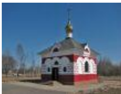
Часовня в память «Всех святых»

Монумент располагается при входе в Рыбинские шлюзы со стороны Рыбинского водохранилища, на песчаной косе, выдвинувшейся в море ~ на 400 м.